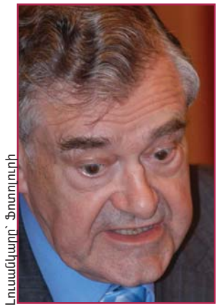
Ավելի շատ խոսում են, քան գործում. ոմանք մեղադրում են Եվրո- պայի խորհրդի քարտուղար Թերի Դևիսին և ԵՄ-ին՝ իշխանությունների նկատմամբ խիստ պատժա- միջոցներ չկիրառելու համար: