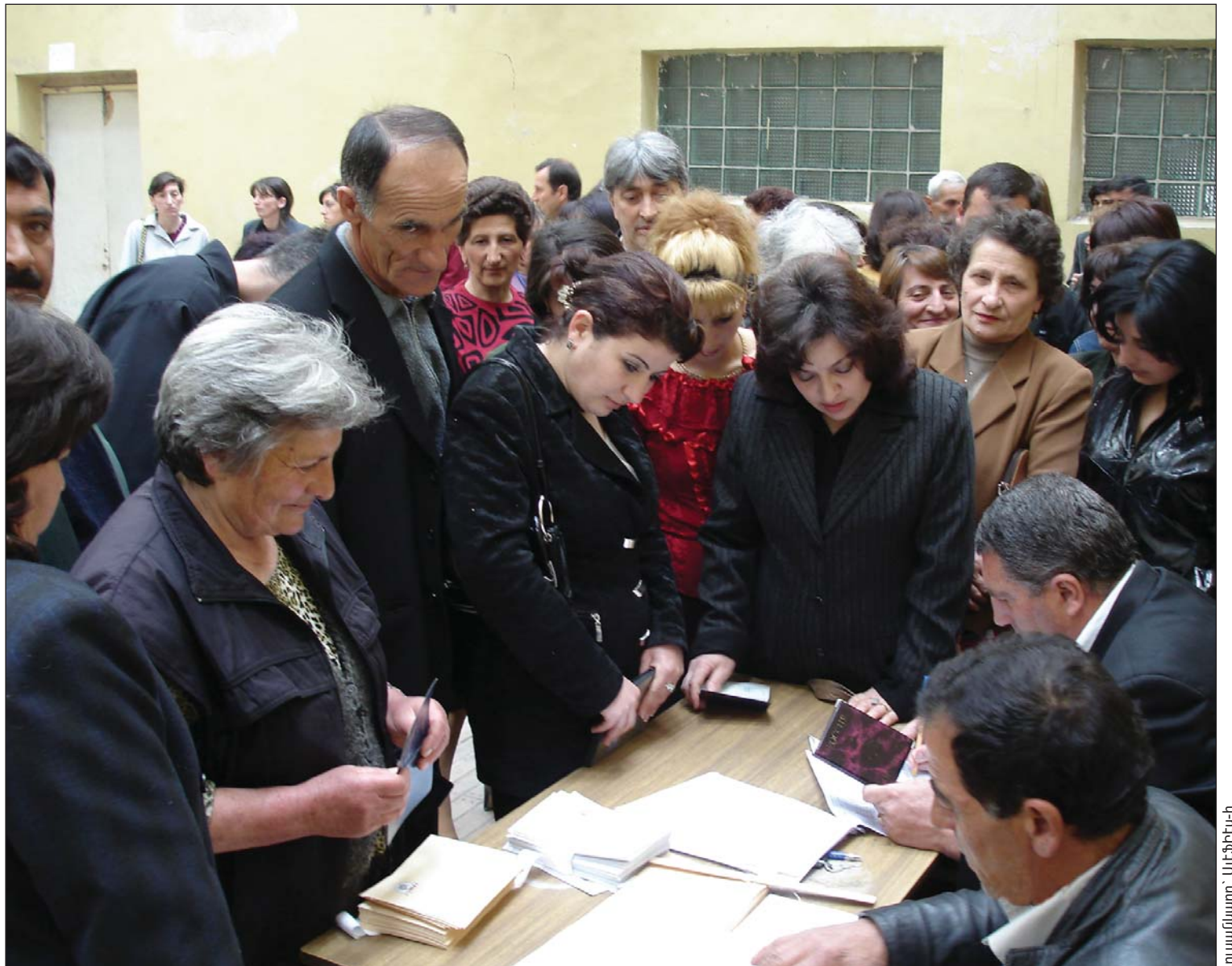
Տեսն և սովորիչ: Փետրվարի 19-ի նախագահական ընտրությունները Արթիկում: Ընտրական համակարգերի միջազգային հիմնադրամի դիտորդների կողմից արձանագրված այս պատկերը ակնհայտ խախտման օրինակ է, որը կարող է վտանգել ձեր քվեարկության գաղտնիությունը. ընտրատեղամասում միաժամանակ 15-ից ավելի անձանց ներկայությունն արգելվում է:

Տարբեր գույնի թանաք օգտագործելը ցույց կտա ձեր քվեարկությունը: 2007 թ. Աժ ընտրությունների ժամանակ Սիսիանում ուսուցիչներին ստիպել էին գունավոր գրիչներով քվեարկել, որպեսզի հավաստիանան, որ նրանք խոստացած թեկնածուին են ձայն տվել: Նման դեպքերում պետք է օգտագործել խցիկում պարտադիր առկա գրիչը (անգամ կարող եք ունենալ ձեր սովորական կապույտ գրիչը): Այս դեպքում քվեատուփի հարյուրավոր քվեաթերթիկներից ոչ ոք չի կարող տարբերակել, թե ո՞րն է ձեր: