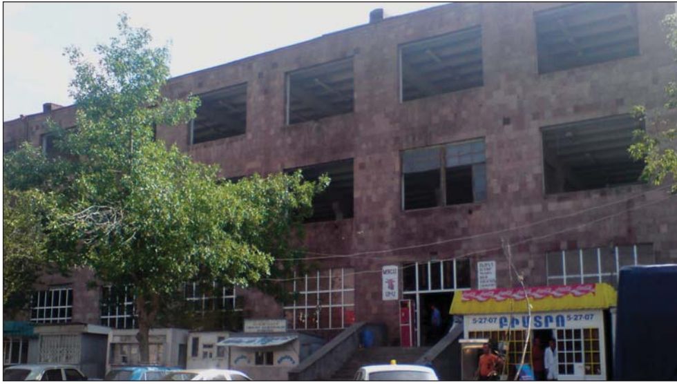
Արթիկի երբեմնի հզոր գործարանն այսօր դարձել է խանութ: Շիրակի մարզի նախկին արդյունաբերական կենտրոնի ընտրողները, ինչպես մյուս մարզերում, ակնկալում են նոր տնտեսական հնարավորությունների ստեղծում:

2007 թ. նոյեմբերին ԱՅԹԵՄ-ի անցկացրած հարցմանը Արթիկի քաղաքացիները պատասխանել են, որ նախագահական թեկնածուի ընտ-