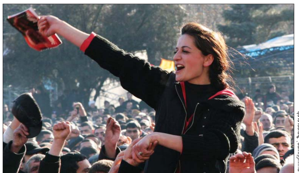
Ի գորու կլինեն՞ արդյոք իշխանությունները մինչև վերջ իրականացնել կոռուպցիայի դեմ պայքարը

միջին օղակներում կա կաշառք, սպա դա վկայում է, որ վերեններում նույնպես տեղյակ են դրա մասին, - պնդում է Կոստանյանը: - Եթե ձերբակալվում է միայն մի քանի մարդ, իսկ պայքարը շարունակական բնույթ չի կրում, ուրեմն այն միանշանակորեն չի հանգեցնի որևէ լավ արդյունքի»: Այնուհանդերձ, թե կառավարությունն իր պայքարում լինի վճռաբեկ և մինչև վերջ գնա, արդյոք պատրաստ կլինի՞ այդ արշավին «զոհարելու նախարարներին, մարզպետներին և բարձրաստիճան պաշտոնյաներին», - կասկածում է նա: Հանրային կարծիքների ուսումնասիրությանը զբաղվող Ադիբեկյանը վիճարկում է, որ այն փաստը, որ 2003 թ. արշավը բավարար արդյունքներ չտվեց, լրացուցիչ ճնշում է գործարդում կառավարության վրա՝ այս անգամ չսխալվելու պարտադրանքով: «Եթե ամբողջ համակարգը կոռումպացված է, և դա այդպես է, ապա հրամանները և որոշումներն իրենց նպատակին չեն հասնի, իսկ այդ դեպքում բարեփոխումների շուրջ քննարկումներ չեն կարող լինել, - ասում է Ադիբեկյանը, - հետևաբար, իշխանությունները կանեն ամեն ինչ, որպեսզի հակակոռուպցիոն արշավի